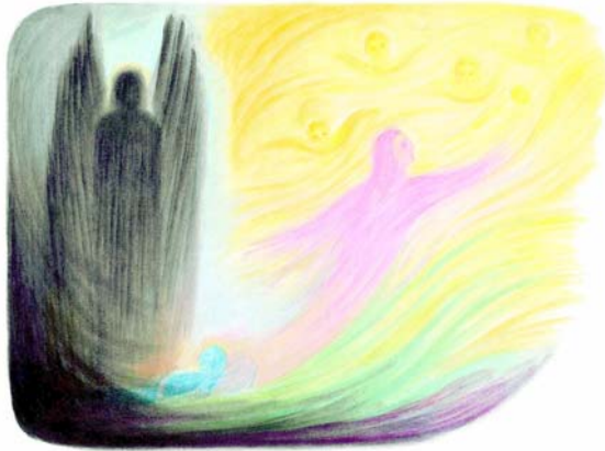
Todeserlebnis TI 08 1959 (86 x 62 cm) siehe auch Ein Totenbuch

Schwer war der Weg im Zeitenstrom zum dunklen Todestor. Schwer löste sich die Seele aus dem Erdenleib Und finstre Furcht verengte sie. Aber der Friede breitete sich Und nahm sie schützend in seine Schwingen. Da leuchtete das Licht der Geisteswelt auf, Und Freundesseelen empfingen mich. Ernst steht der lichte Hüter, Und die Seele hat Vertrauen zum Kommenden.