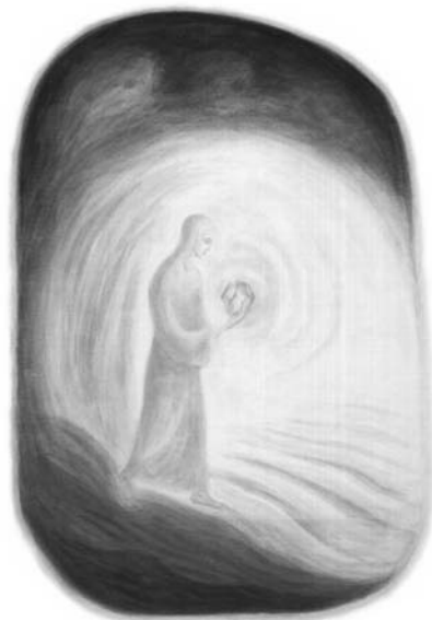
"An der Schwelle" Bild 6. aus "Ein Erkenntnisweg in Bildern"

siebengliedrigen Wahrnehmungsstufen. Die "Erkenntnisweg" Bilder hat man versucht, in Reihen zu betrachten, um neuen Sinn durchscheinen zu lassen. Immer wieder hat man ganz intensiv Fragen gestellt und Abbildungen "blind" aus der Reihe gezogen, manchmal mit verblüffender Bedeutung für Individuum und Gruppe.